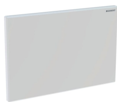
Figura di esempio