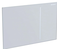
Figura di esempio