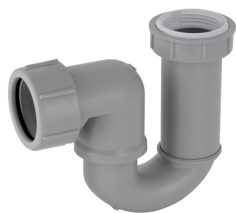
Figura di esempio